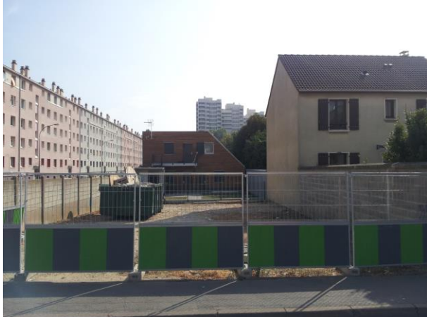
Terrain - 67, rue Auguste Delaune à Villejuif